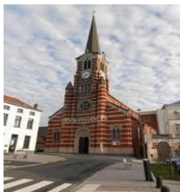
Paroisse de Rebecq