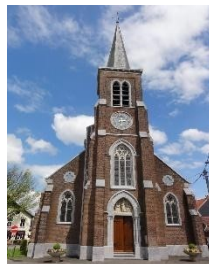
Paroisse de Wisbecq