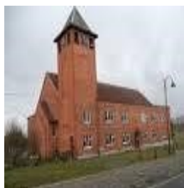
Paroisse de Bierghes