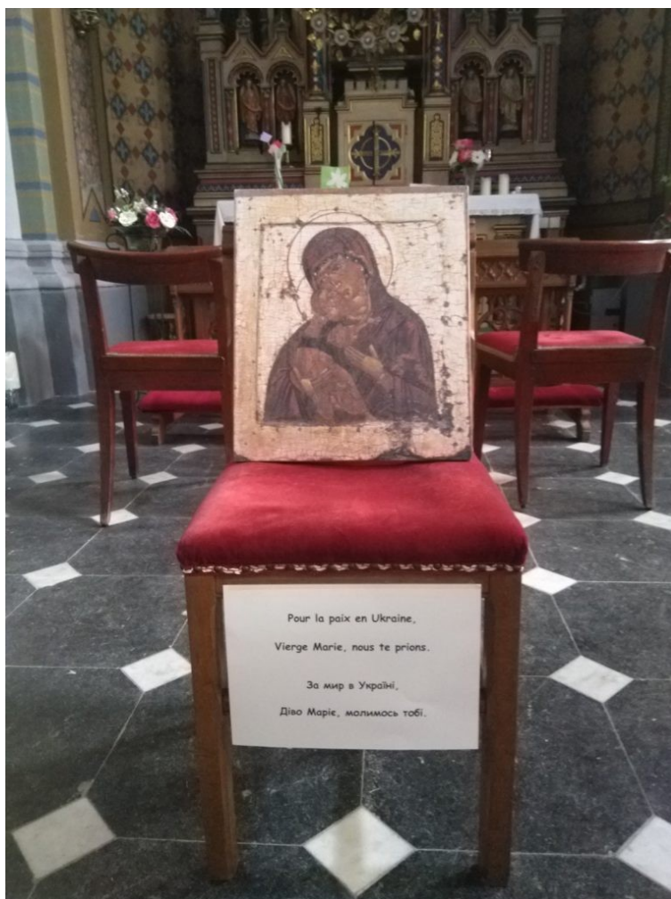
Église St-Géry de Rebecq – chapelle de la Vierge